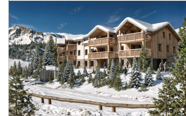
RÉSIDENCE DE 16 LOGEMENTS A HUEZ

Nota : Plans non contractuels - Documents susceptibles de subir des modifications de dimensions et d'équipements en fonction des contraintes techniques de constructions. - Les cotes, les surfaces ainsi que la position des éléments techniques sont donnés sous réserve des impératifs de construction et des tolérances d'exécution. - Les retombées, poutres, soffites, faux plafonds et canalisations ne sont pas tous représentés sur le plan de vente et figurent au documents techniques.